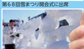
第68回雪まつり開会式に出席