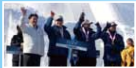
3位のハワイチームにメダル授与