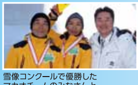
雪像コンクールで優勝したマカオチームのみなさんと